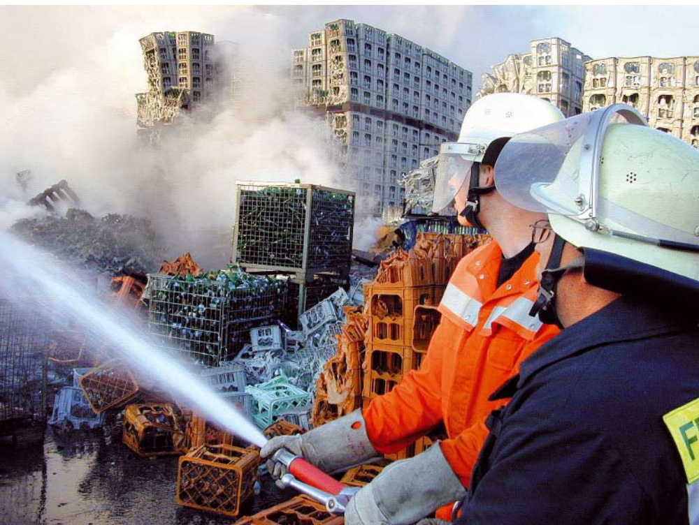
Abb. 2: Lagerbrand mit Feuerwehrleuten.

Bidirektionale Kommunikationsgeräte verbieten sich generell in Bereichen, in denen hochempfindliche Maschinen und Anlagen durch deren Strahlungen gestört werden können. Das gilt zum Beispiel für Krankenhäuser, Serverräume, Kernkraftwerke, Raffinerien, Anlagen der chemischen Industrie und Kunststoffproduktion, in denen Mobiltelefone meist tabu sind. Als Alternative gelten spezielle Betriebsfunkanlagen, die von der Physikalisch-Technischen Bundesanstalt für den Einsatz in der Ex-Schutz-Zone 1 zugelassen sind. Zone 1 heißt: Eine gefährliche explosionsfähige Atmosphäre durch Gase, Dämpfe oder Nebel kann im Normalbetrieb gelegentlich auftreten. Solche Betriebsfunkanlagen sind jedoch kostenintensiv und gelten nicht für die Zone 0 mit einer ständigen oder häufigen explosionsfähigen Atmosphäre.