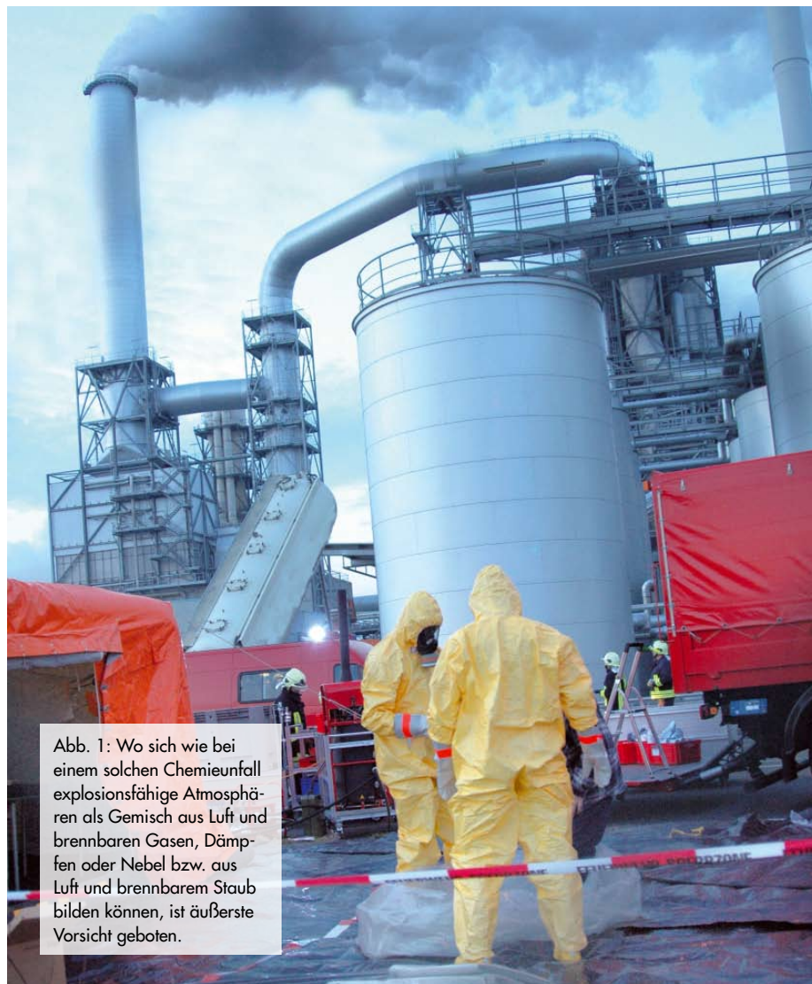
Abb. 1: Wo sich wie bei einem solchen Chemieunfall explosionsfähige Atmosphären als Gemisch aus Luft und brennbaren Gasen, Dämpfen oder Nebel bzw. aus Luft und brennbarem Staub bilden können, ist äußerste Vorsicht geboten.

Durch die beim Betrieb von mobilen Funkgeräten vorhandene Strahlungsenergie kann in einem explosionsgefährdeten Raum oder Areal eine gefährliche Zündenergie verursacht oder freigesetzt werden. Bidirektionale Kommunikationsgeräte verbieten sich generell in Bereichen, in denen hochempfindliche Maschinen und Anlagen durch deren Strahlungen gestört werden können. Als Alternative gelten spezielle Betriebsfunkanlagen, die von der Physikalisch-Technischen Bundesanstalt für den Einsatz in der Ex-Schutz-Zone 1 zugelassen sind. Solche Betriebsfunkanlagen sind jedoch kostenintensiv und gelten nicht für die Zone 0 mit einer ständigen oder häufigen explosionsfähigen Atmosphäre. Eine Lösung bietet der Einsatz von Pagern, wie dieser Beitrag zeigt.